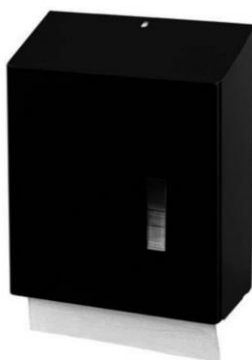
HSU31 Black en inox poudré noir mat