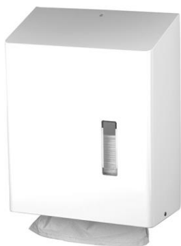
HSU31P en inox poudré blanc