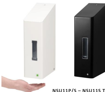
NSU11P/S – NSU11S Touchless : en inox poudré blanc ou noir mat