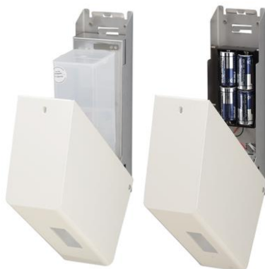
Réservoir réemplissable. Alimenter par 4 batteries