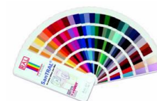
En option : choix entre 210 couleurs RAL (prix sur demande).