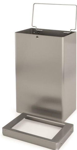
Avec un couvercle ouvert et un porte-sac solidaire à poubelle.

Un sac en plastique augmente les conditions d'hygiène et facilite l'entretien. Réf. ZD21 : sac 45x50cm – LDPE type 25 – noir (carton de 40 x25 = 1000)