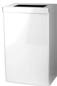
EBU18P : en inox poudré blanc