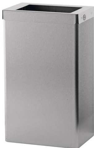
EBU18E : en inox brossé AFP = avec un revêtement de protection contre les taches et empreintes.