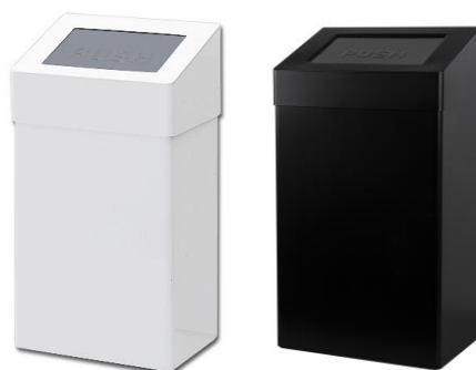
ABU50P – ABU50 BLACK: en inox poudré blanc ou noir mat