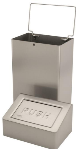
Couvercle Push / Porte-sac solidaire à poubelle.

Réf. ZD05 : sac 60x90cm – LDPE type 50 –gris (carton de 10 x25 = 250)