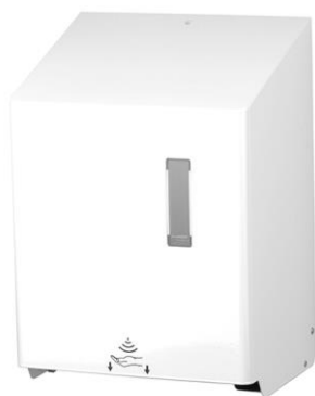
HTU1P en inox poudré blanc

HTU1E : en inox brossé AFP = avec un revêtement de protection contre les taches et empreintes.