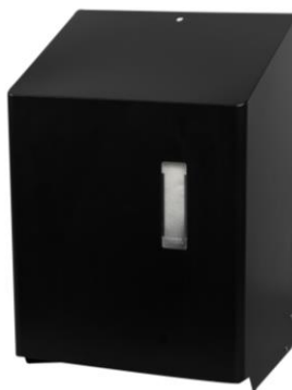
HTU1 Black en inox poudré noir mat