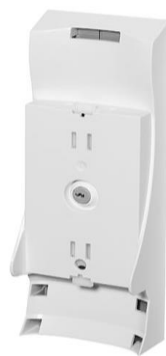
Attache pour une fixation murale