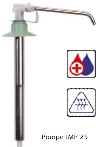
Pompe IMP 25